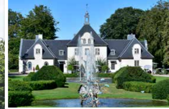
Villa Abelin som det ser ut idag.