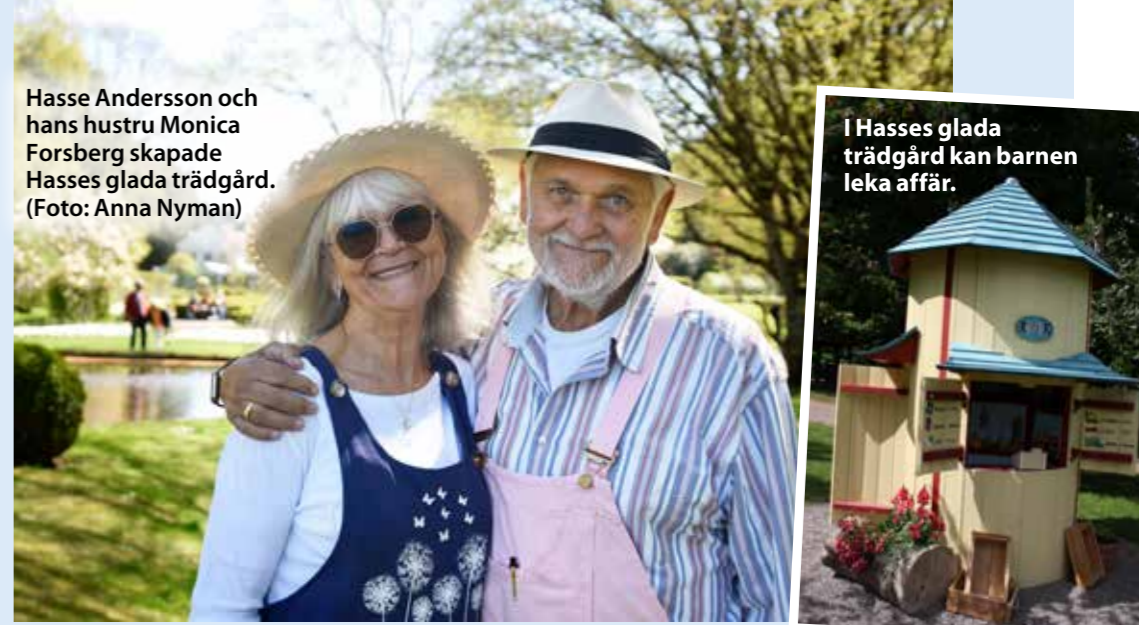
I Hasses glada trädgård kan barnen leka affär.

Artisten Hasse Andersson har skapat barnens trädgård