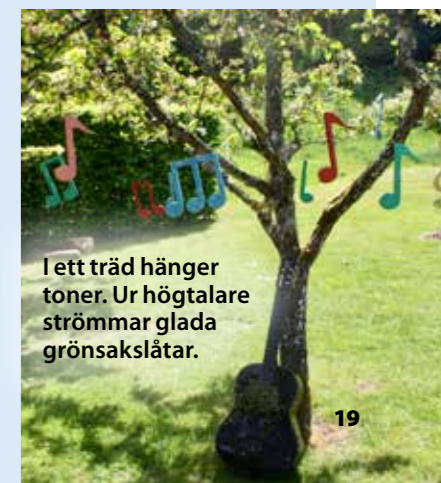
I ett träd hänger toner. Ur högtalare strömmar glada grönsakslåtar.

– Det är fantastiskt att möta alla barn och föräldrar på konserter och sommarkonserter då vi bjuder in barn för att läsa sagor, sjunga och ha det mysigt tillsammans på Norrviken. Vi inviger säsongen varje vår på internationella busfrödagen. Då delar vi ut frön som vi sår tillsammans i en lång rabatt. Barnen kan sedan följa hur det växer och på hösten skördar vi allt möjligt – till och med meloner. ■