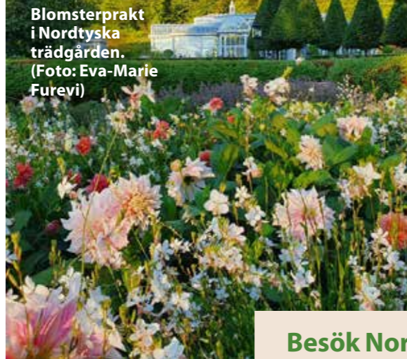
Blomsterprakt i Nordtyska trädgården.