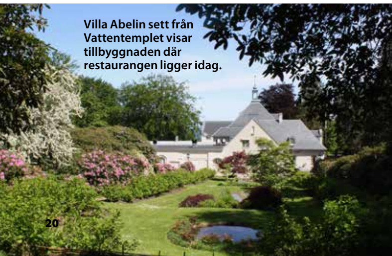
Villa Abelin sett från Vattentemplet visar tillbyggnaden där restaurangen ligger idag.

– Ja, jag är genuint intresserad. Jag kan lite om mycket och är med lite på ett hörn. Norrviken ger ett lugn. Många säger det när de kommer hit. Självt går jag ibland ner till den japanska trädgården på sommarkvällarna, men även på hösten. Det är nog min favoritplats. ■