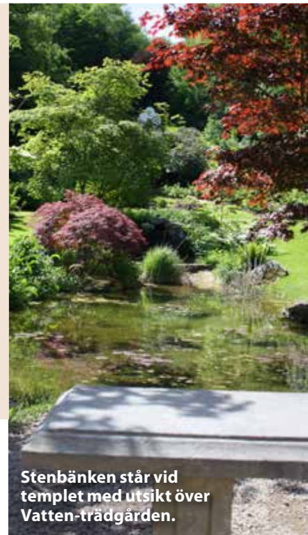
Stenbänken står vid templet med utsikt över Vatten-trädgården.